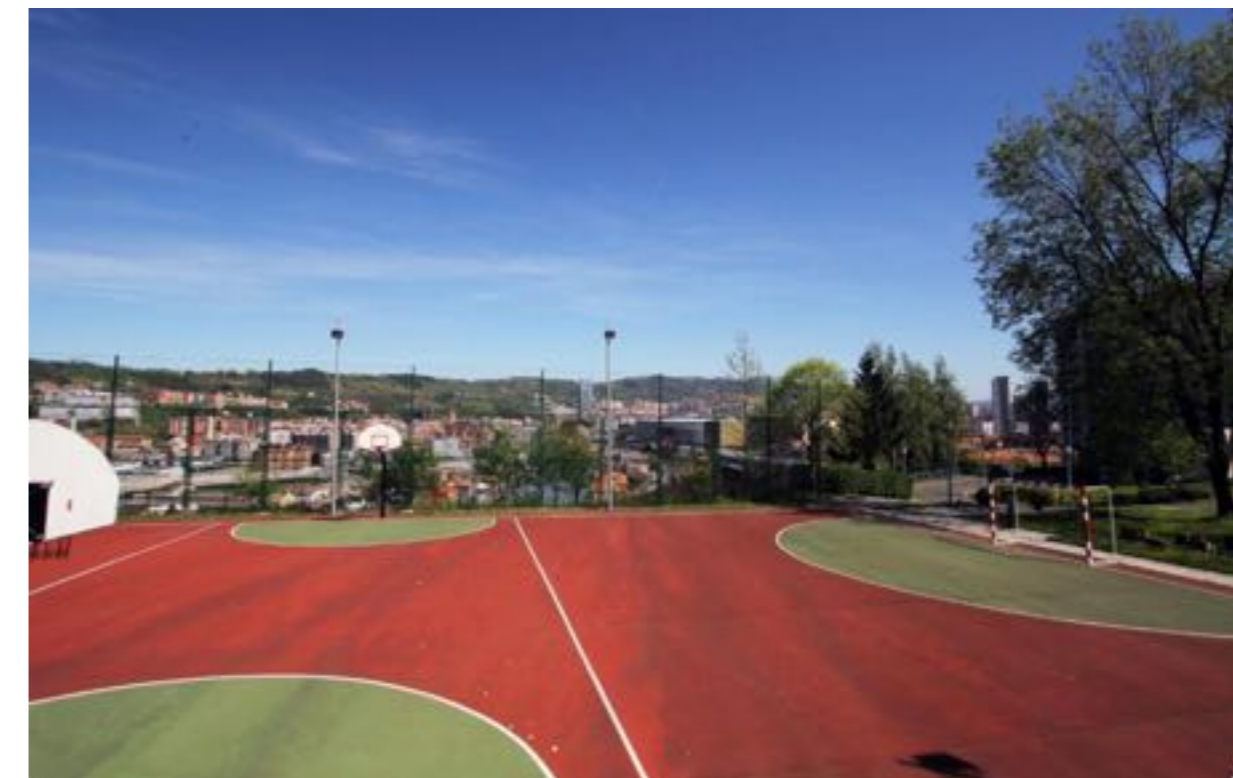
DES ESPACES DE LOISIRS AU SEIN DE L'HEBERGEMENT